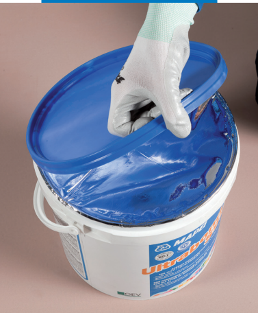
Snadné otevření víka