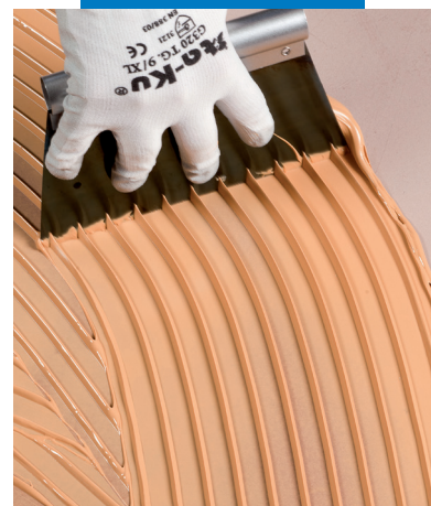
Výborné uchování a stabilita výrobku

Informace o tomto výrobku jsou k dispozici na požádání a na stránkách firmy MAPEI www.mapei.cz a www.mapei.com