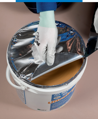
Snadné a rychlé odstranění těsnicí fólie