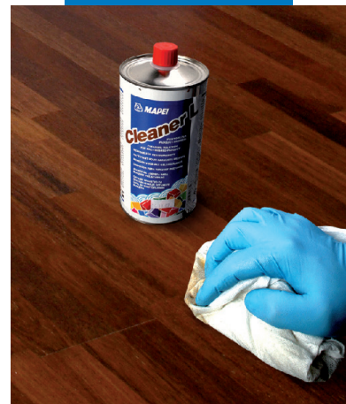
Čištění velkého formátu vícevrstevných parket s použitím výrobku Cleaner L