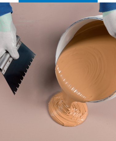
Výborné uchování a stabilita výrobku