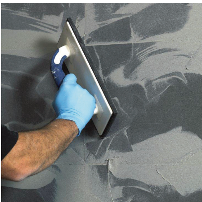
Plynulé a jednoduché spracovanie počas 40 minút...

4 Po vytvrdnutí odstrániť zvyškový maltový povlak mierne vlhkou špongiou.