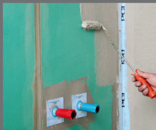
PCI Pecitape® 10x10 – izolácia prestupov PCI Pecitape® Objekt – izolácia kútov