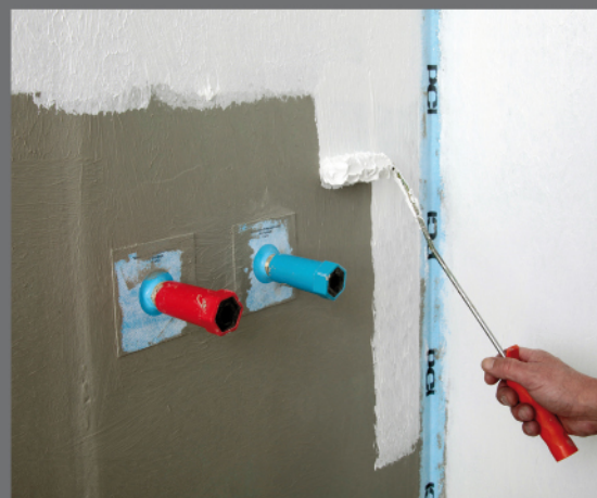
PCI Lastogum® – izolácia plôch