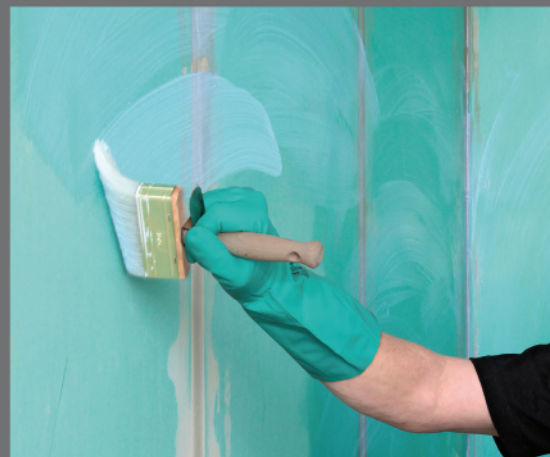
PCI Gisogrund® PGM – penetrácia podkladu

Špeciálna gumená kaširovaná manžeta na utesnenie prechodov rúrok.