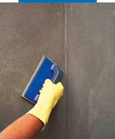
Dokončenie povrchu špongiou