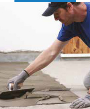
Aplikácia lepidla s použitím zubovej stierky č.5