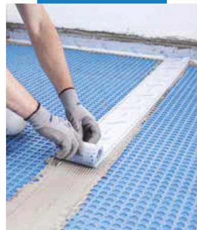
Zaizolovanie škáry vzniknutej medzi príhlými pásmi s použitím pásky Mapeband Easy nalepenej do Mapeguard WP Adhesive