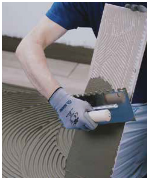
Lepenie keramickej alebo kanenej dlažby použitím lepidla Mapei (min. trieda C2) v závislosti od formátu dlažby