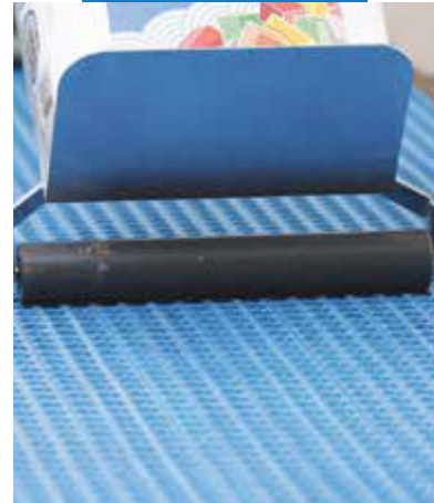
Zatlačenie Mapeguard UM 35