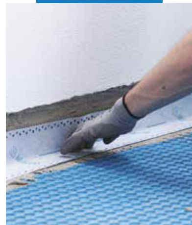
Zaizolovanie škáry v styku-stena podlaha s páskou Mapeband Easy nalepenou do Mapeguard WP Adhesive