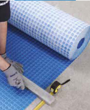
Narezanie Mapeguard UM 35