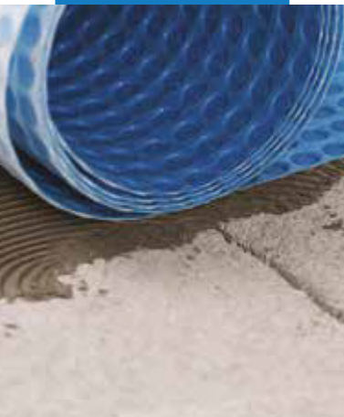
Inštalácia Mapeguard UM 35