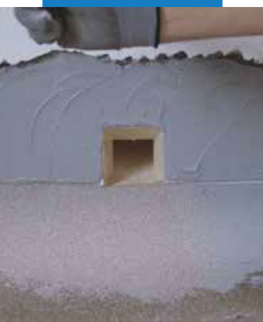
Zaizolovanie odtokovej vpuste s Drain Front