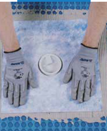
Zaizolovanie odtokovej vpuste s Drain Vertical/ DrainLateral

Príslušné odkazy na produkt sú k dispozícii na vyžiadanie alebo na www.mapei.sk a www.mapei.com