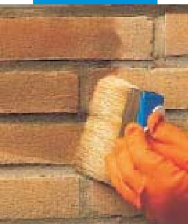
1. Nanášení Antipluviolu S štětkou

Výše uvedené návody a předpisy vycházejí z našich nejlepších zkušeností a je nutno je dodržovat. Tyto návody považujeme za indikativní a musí být potvrzeny praktickým použitím výrobku. Z tohoto důvodu doporučujeme předem posoudit vhodnost výrobku pro předpokládané použití. Spotřebitel přejímá veškerou zodpovědnost za používání výrobku.