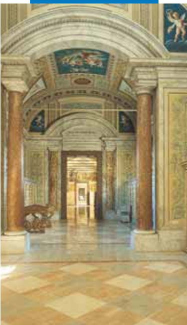
Príklad inštalácie žuly s lepidlom Granirapid Vatikán - Rím

podklad so zubovou stierkou č.6. Potom uložte dosku „čerstvé do čerstvého“.