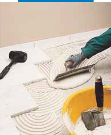
Inštalácia jurského mramoru bielym lepidlom Granirapid

farby s obsahom kremičitého piesku (zložka A) a syntetického gumového latexu (zložka B). Granirapid sa vyznačuje najmä rýchlym priebehom tvrdnutia a hydratácie. Podlahy je možné vystaviť už po 3 hodinách ľahkej pešej záťaži, úplne vyschnuté sú po 24 hodinách. Granirapid má malé zmršťovanie a výborné lepiace vlastnosti, ktoré ho predurčujú používať na problematické podklady. Vďaka mechanickým vlastnostiam je odolný proti nárazom, vibráciám, teplotným zmenám, starnutiu a riedeným chemickým látkam.