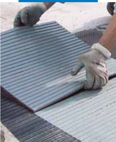
Inštalácia sklenenej mozaiky bielym lepidlom Granirapid