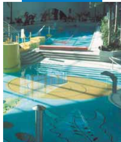
Príklad inštalácie mozaiky a klinkera v plaveckom bazéne