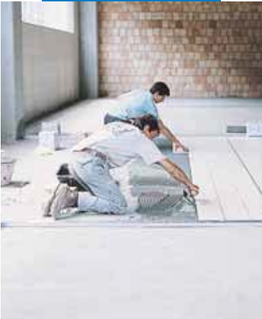
Inštalácia porcelánovej dlažby vo výrobnom závode