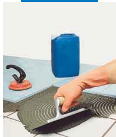
Inštalácia aglomerovaného obkladu na existujúci keramický obklad šedým lepidlom Granirapid