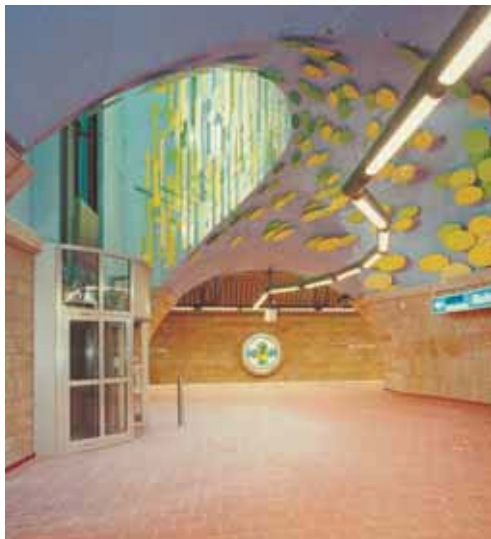
Príklad inštalácie žuly s lepidlom Granirapid v podchode v Mulheim Ruhr, Nemecko.