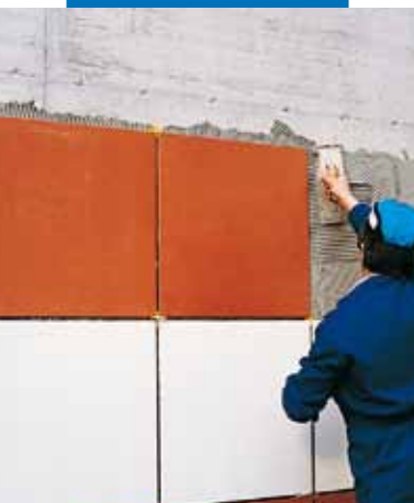
Inštalácia obkladových prvkov veľkého formátu s použitím Kerabond T + Isolastic