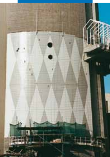
Príklad inštalácie obkladových prvkov Klinker na betón použitím Kerabond + Isolastic - Telekomunikačná veža, Kuvajť City, Kuvajť