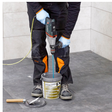
Dôkladne premiešať. Aby bola zaručená homogénnosť zmesi, mal by sa materiál preliať do inej nádoby a ešte raz premiešať.