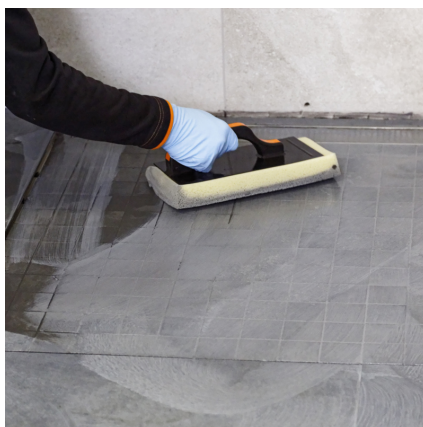
Po cca 10 - 45 min naemulgovať (zjednotiť) plochu špongiou a umyť dočista.