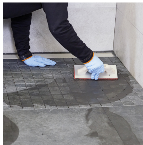
Veľmi ľahké škárovanie bez zvyškového povlaku s PCI Durapox Premium (Multicolor).