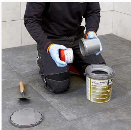
PCI Durapox® Premium (Multicolor) (2 kg) otvoriť a vybrať druhú zložku.

2.4 Po vytvrdnutí škárovacej hmoty je možné prípadný zvyšný povlak odstrániť nasledujúci deň s PCI Durapox® Finish . Väčšie znečistenia vyčistiť s PCI Duraclean EP .