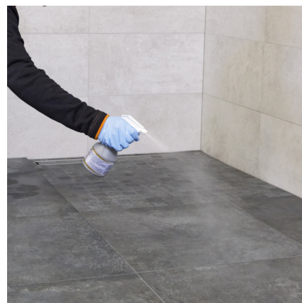
Pred záverečným čistením, po cca 60 min. nastriekať na plochu PCI Durapox® Finish (tekutý).