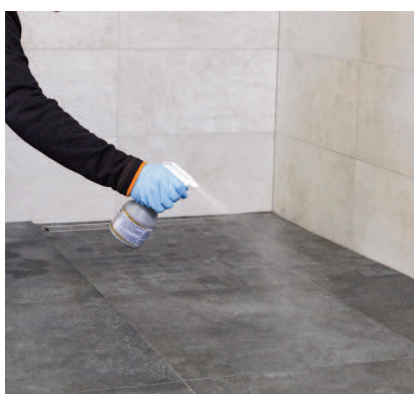
Nastriekanie PCI Durapox® Finish (tekutina) pred záverečným umývaním.