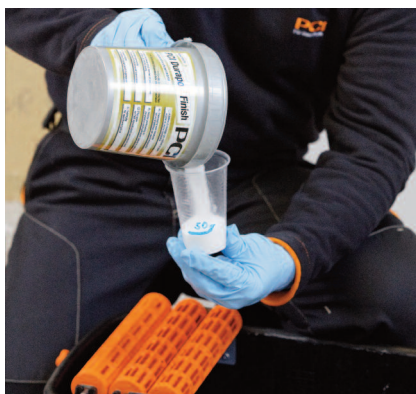
Pridávanie PCI Durapox® Finish (koncentrát) do vody na umývanie. Pomer miešania 1 : 100.