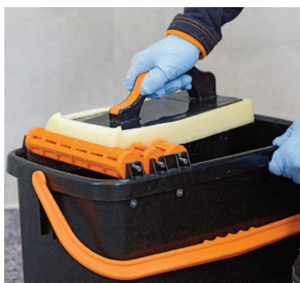
Vodu na umývanie vymieňať v pravidelných intervaloch.